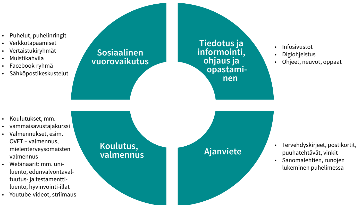
Kuva 2. Etäpalvelut: Digiloikka ja muut etäratkaisut.

Verkossa toteutettujen palvelujen lisäksi myös perinteiset puhelinsoitot nousivat merkittävään rooliin ikäihmisten ja omaishoitajien kontaktoinnissa, kuulumisten kyselemisessä, tiedon jakamisessa ja ohjauksessa ja avuntarpeiden kartoittamisessa. Myös postitse lähetetyt kirjeet